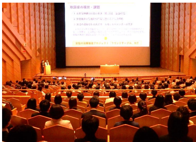
↑ラウンドテーブル講演会の様子